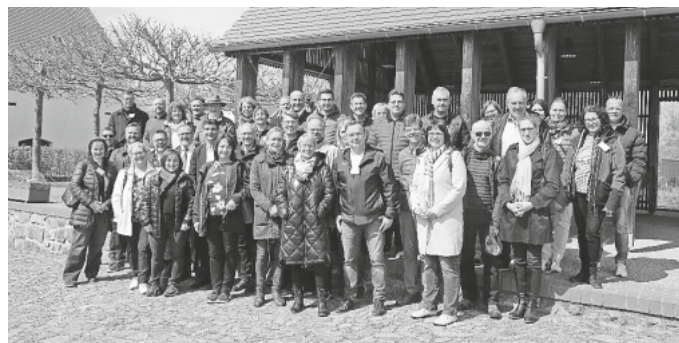
Bildinfo: Die Besuchergruppe aus dem Bodenseekreis gemeinsam mit Vertretern des Landkreises Leipzig im Park Canitz in der Gemeinde Thallwitz.

Der Landkreis Leipzig erstreckt sich südlich und östlich um die Großstadt Leipzig. Rund 260.000 Menschen leben hier auf 1.651 Quadratkilometern.